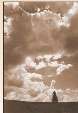
Obľúbená téma – stromy a dramatické búrkové mraky. Opäť Orava.