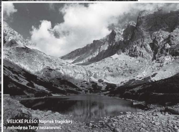
VELICKÉ PLESO: Napriek tragickej nehode na Tatry nezanevrel.