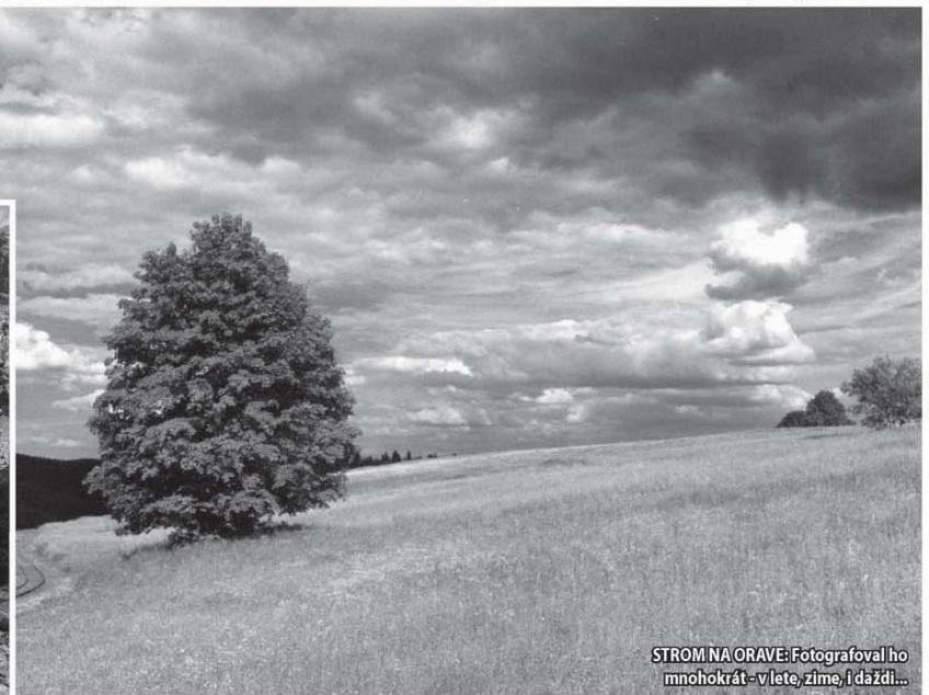
STROM NA ORAVE: Fotografoval ho mnohokrát - v lete, zime, i daždi...