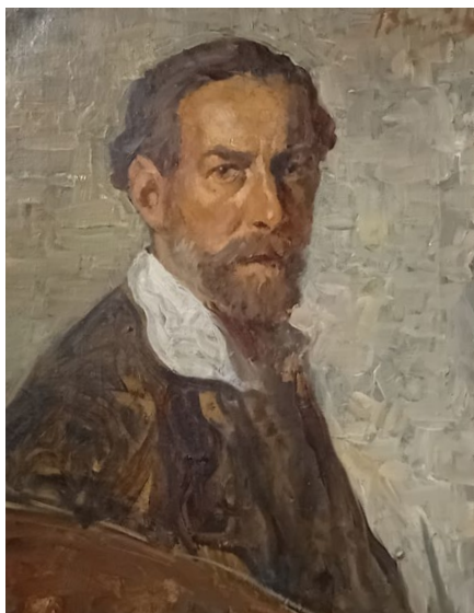
Za najhodnotnejšie Borúthove diela sa považujú podobizne členov vlastnej rodiny a množstvo autoportrétov.